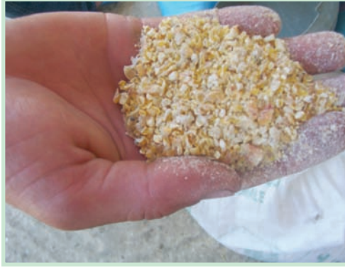
سحق مثالي للذرة