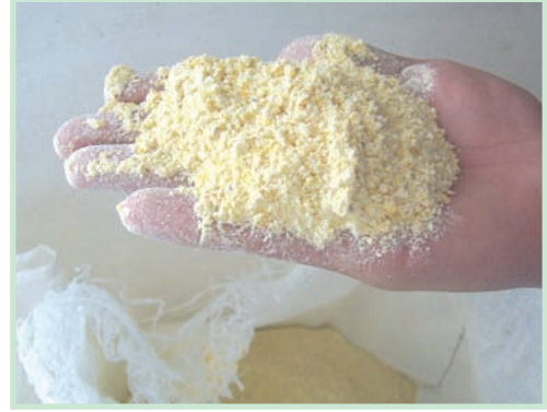
سحق دقيق للذرة