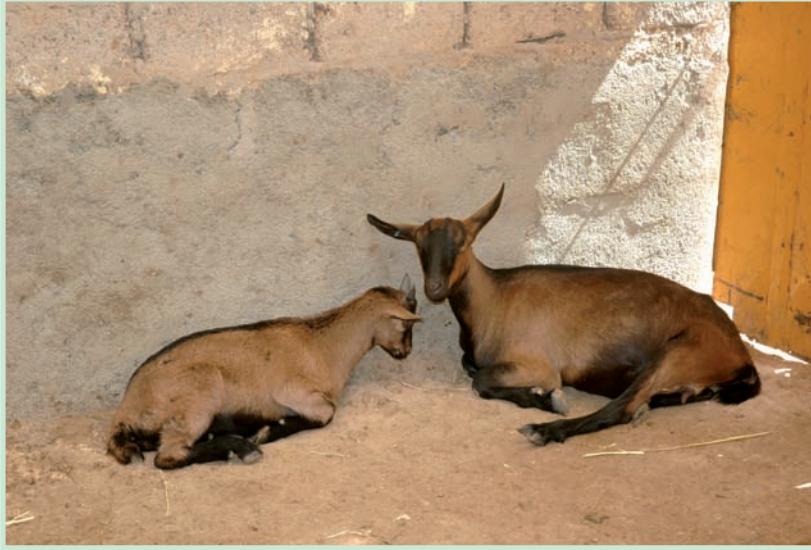
مشروع صغير مدر للرياح

تفترض مقارنة "النوع والتنمية" أن مشاريع إدماج المرأة في التنمية قد تحسن ظروف المرأة الاقتصادية والاجتماعية ولكنها لا تغير وضعها الاجتماعي. هذه المقاربة تعزل المرأة وقد تخفي الدينامية، أما مفهوم النوع الاجتماعي فهو اشمول و يأخذ بعين الاعتبار مصالح وأدوار ومسؤوليات النساء والرجال.